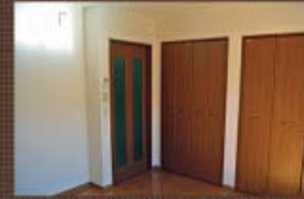
居室 6帖 (警報装置装備)