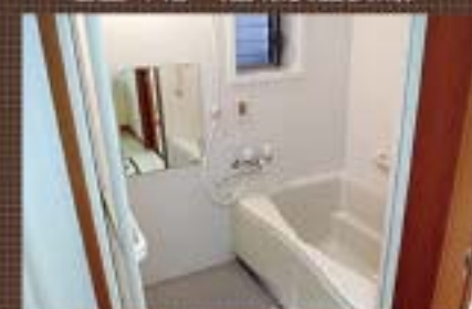
浴室 (警報装置装備)