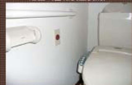
トイレ (警報装置装備)