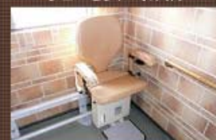
いす式階段昇降機