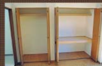
クローゼット・押入れ